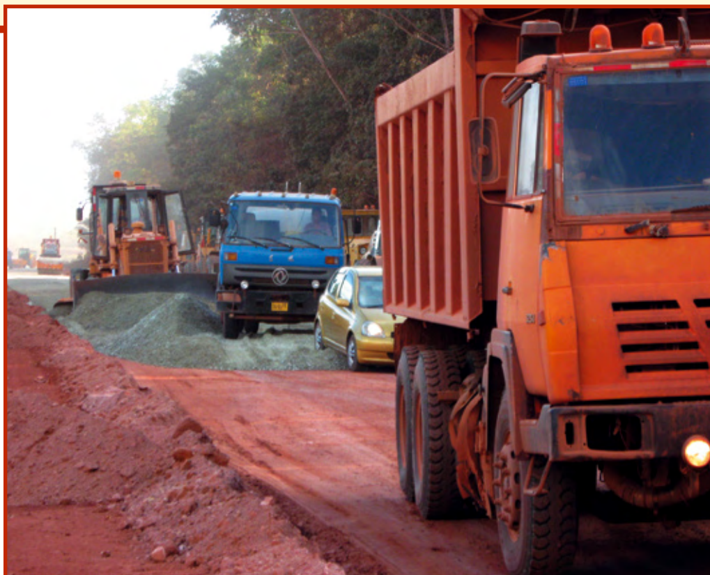
Afobakaweg