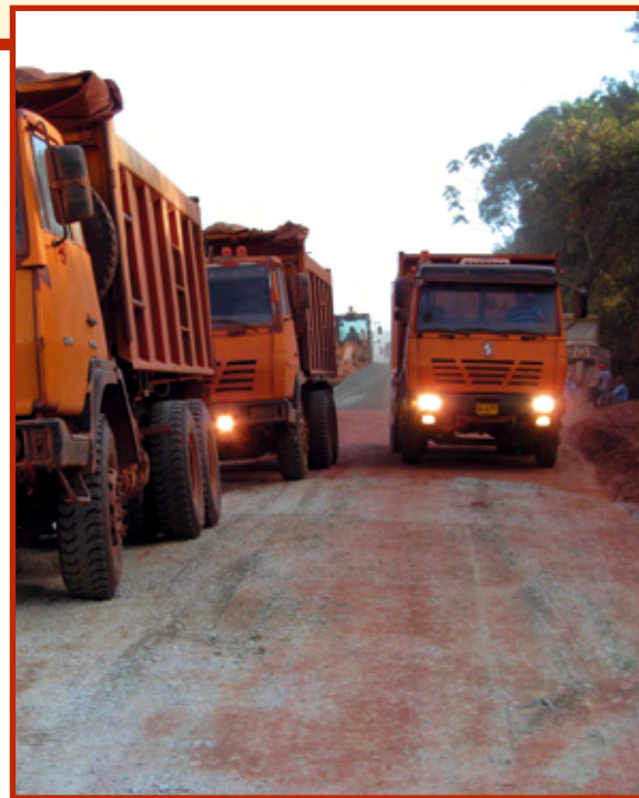
Chinese arbeiders asfalteren de Afobakaweg

En inderdaad weten steeds meer buitenlandse toeristen de weg te vinden naar de resorts om er te genieten van de weelderige natuur en de cultuur van de marrons en indianen. Eco-toerisme is booming business geworden. Maar niet alleen westerse toeristen trekken het regenwoud van Suriname in. Verspreid over grote delen van het binnenland zijn ook steeds meer goudzoekers actief. Precieze aantallen zijn onbekend, maar het kan wellicht om vijftienduizend of meer - vooral Braziliaanse - gouddelvers gaan, naast